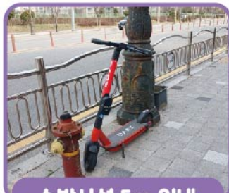
소방시설 5m 이내