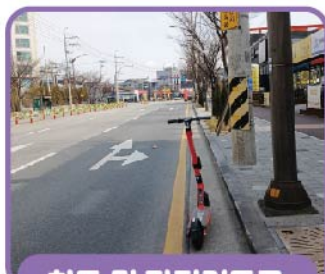
차도 및 자전거도로