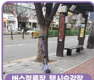
버스정류장, 택시승강장, 경전철역 출입구