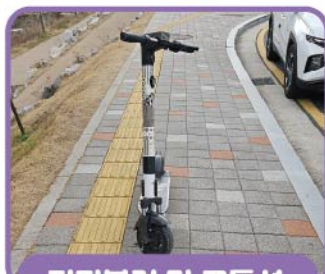
점자블럭 및 교통섬