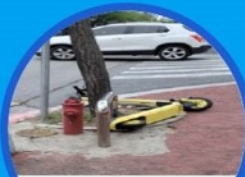
소방시설 5m 이내