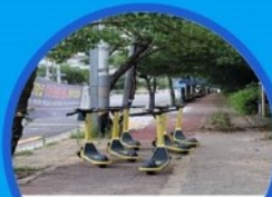
자전거 도로 중앙