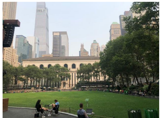
NYC의 Bryant Park에서