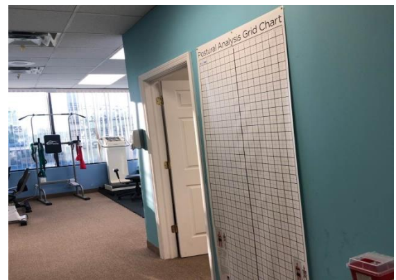
자세 분석을 위한 Grid Chart

이번 미국 임상 실습으로 미국 물리치료사의 업무를 자세히 알게 되고 시스템적인 부분까지 경험할 수 있게 된 것이 좋은 점이라고 생각한다. 와보지 못했더라면 실제로 현지에 왔을 때 당황했을 부분이 분명 많았을 것이다. 미국 물리치료를 꿈꾼다면 아니 조금이라도 생각이 있다면 많은 후배들이 도전해보기를 적극적으로 추천하면서 이번 편을 마친다!