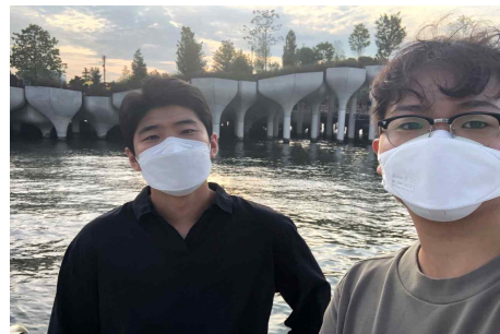
-뉴욕 리틀 아일랜드(Little Island)에서

다음 편에는 병원실습내용뿐만 아니라 우리가 주말동안 여행한 곳에 대한 여러 가지 정보를 제공해보고자 한다.