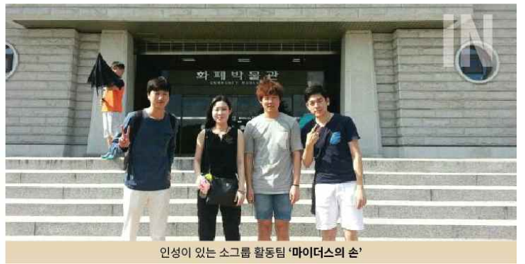
인성이 있는 소그룹 활동팀 '마이더스의 손'