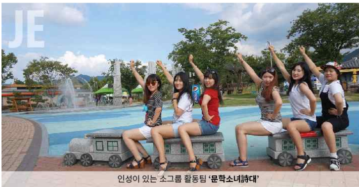
인성이 있는 소그룹 활동팀 '문학소녀시대'