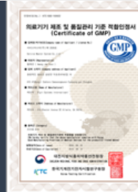
의료기기 제조 및 품질관리 기준 적합인증서