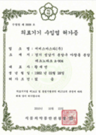
의료기기 수입업 허가증