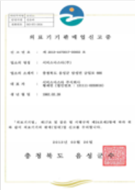
의료기기 판매업 신고증